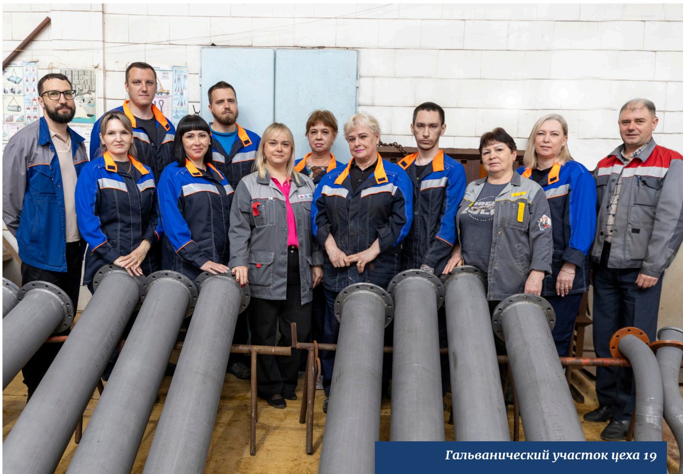
Гальванический участок цеха 19